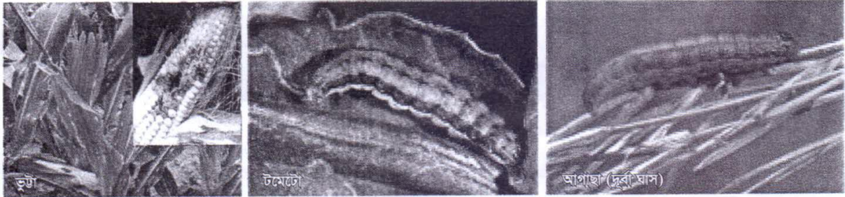
বিভিন্ন ফসলে ফল আর্মিওয়ার্ম এর আক্রমণ