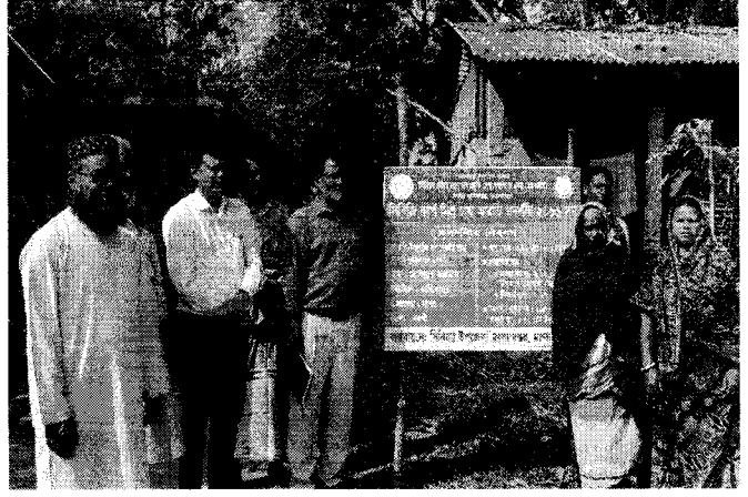
চিত্র ১-২: সম্মানিত বিভাগীয় উপপরিচালক, রাজশাহীসহ মান্দা উপজেলায় ইউনিয়ন প্রকল্পের সিবিজি প্রদর্শনী পরিদর্শন