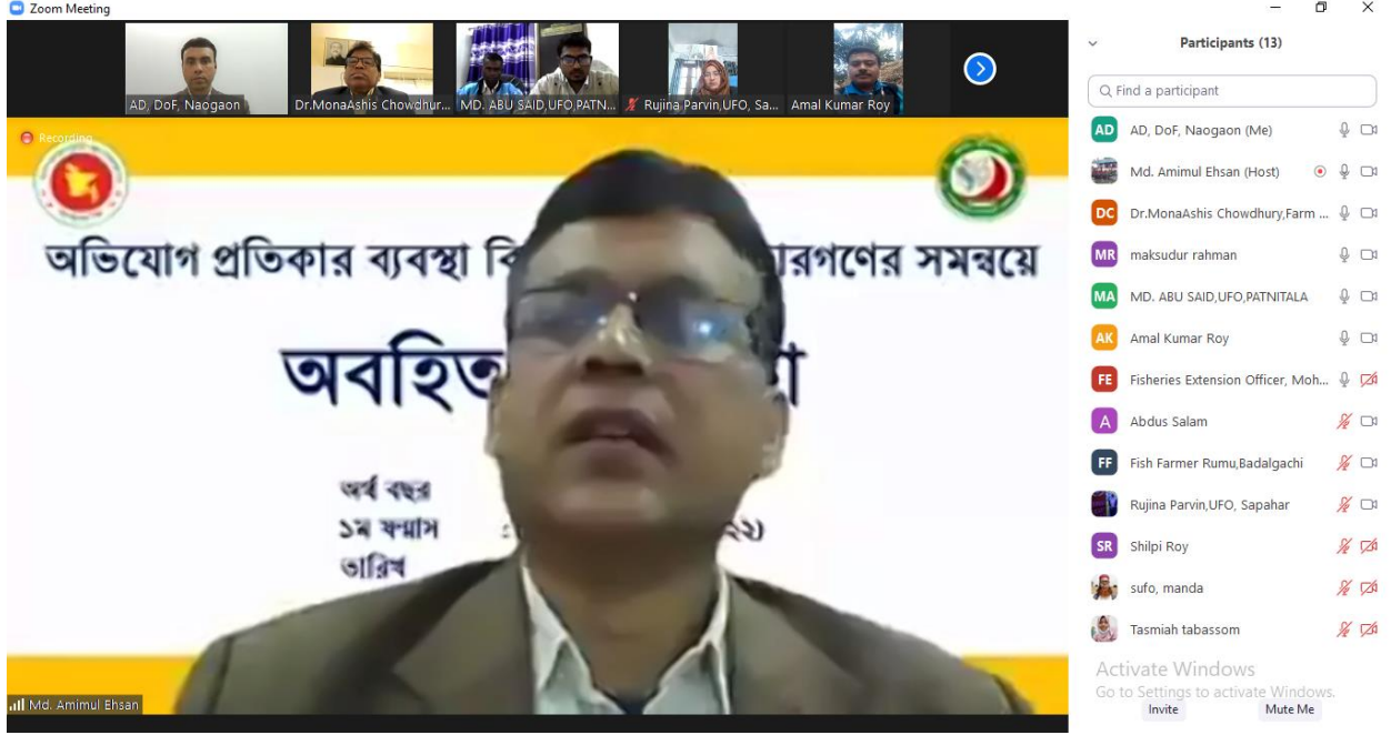
সভায় বক্তব্য প্রদান করেন সম্মানিত জেলা মৎস্য কর্মকর্তা, নওগাঁ