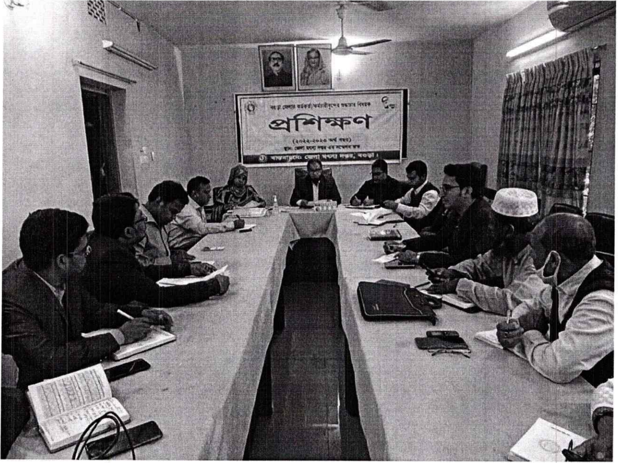
কর্মকর্তা/ কর্মচারীদের শুদ্ধাচার বিষয়ক প্রশিক্ষণ তারিখ: ১১/১২/২০২২খ্রি.