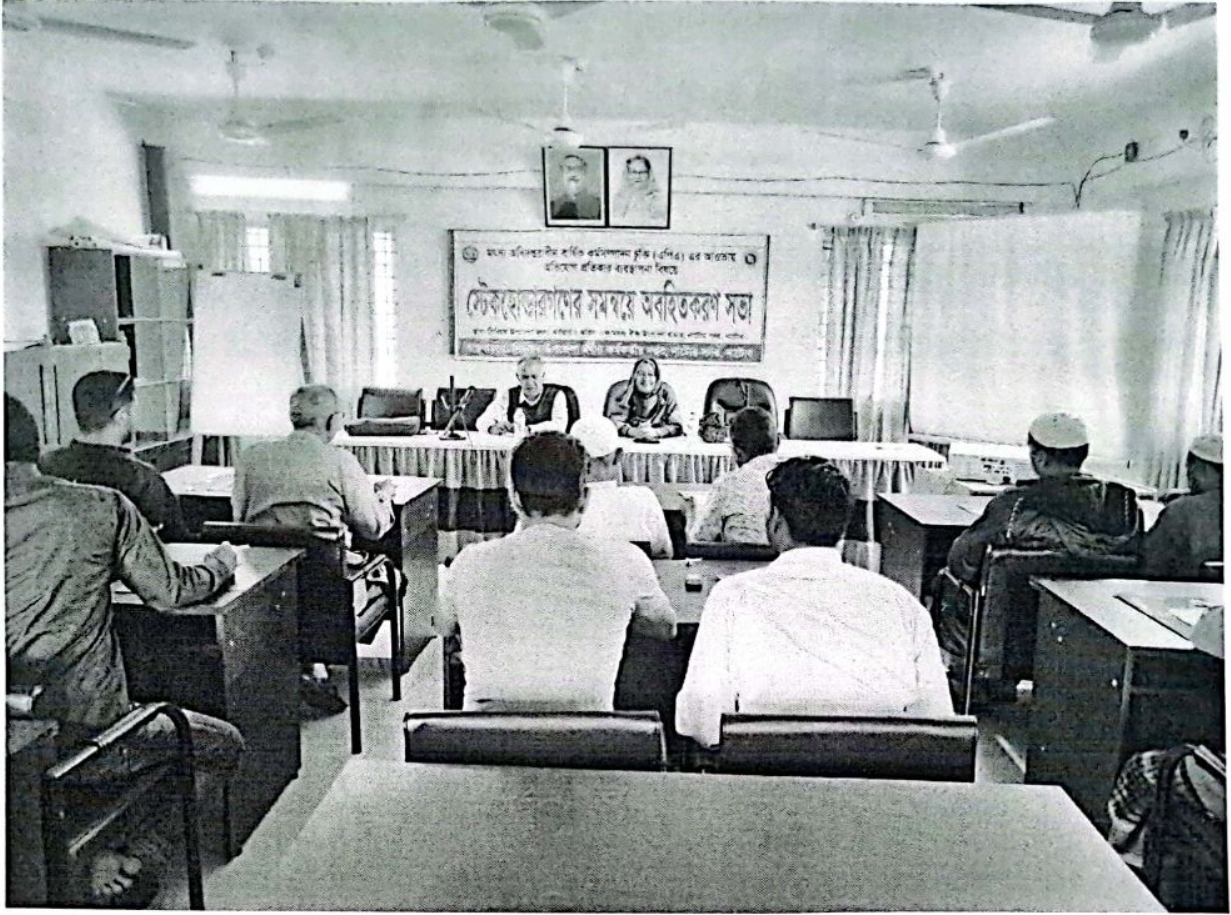
অভিযোগ প্রতিকার ব্যবস্থাপনা বিষয়ে স্টেকহোল্ডারগণের সমন্বয়ে অবহিতকরণ সভা, নাটোর সদর, নাটোর