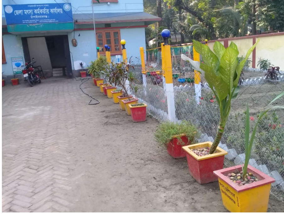
ফুল বাগানের শোভা বর্ধন ও নিরাপত্তা বেষ্টনি নির্মাণের পরের ছবি