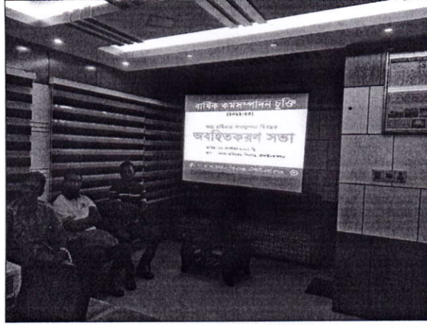
চিত্র-০১: জনসচেতনতা বৃদ্ধিকরণ সভা

তথ্য অধিকার আইন ও বিধিবিধান সম্পর্কে জনসচেতনতা বৃদ্ধিকরণ সভা