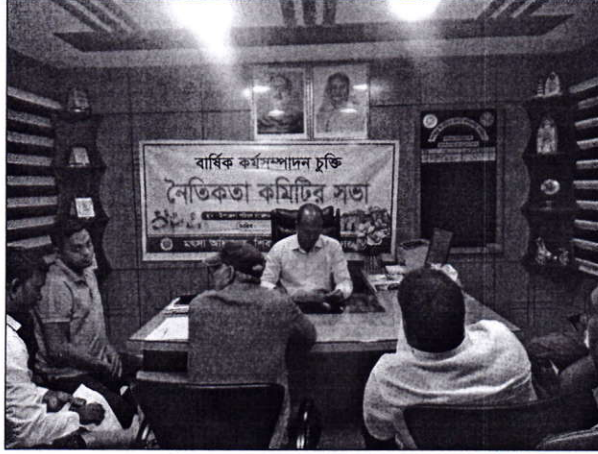
চিত্র-২: নৈতিকতা কমিটির সভা