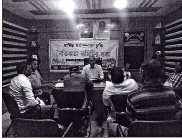
চিত্র-১: নৈতিকতা কমিটির সভা

নৈতিকতা কমিটির সভা ২য় ত্রৈমাসিক প্রতিবেদন: অক্টোবর ২০২৩ হতে ডিসেম্বর ২০২৩ খ্রি.