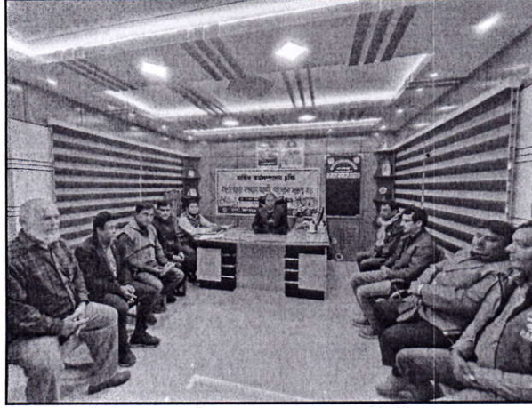
চিত্র-২: নৈতিকতা কমিটির সভার সিদ্ধান্ত বাস্তবায়ন অগ্রগতি বিষয়ক সভা (৩য় ত্রৈমাসিক)

নৈতিকতা কমিটির সভার সিদ্ধান্ত বাস্তবায়ন অগ্রগতি বিষয়ক সভা