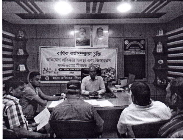
চিত্র: অভিযোগ প্রতিকার বিষয়ক প্রশিক্ষণ