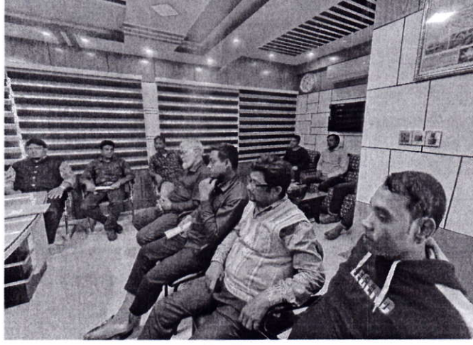
চিত্র-১: কর্মশালা (২য় ত্রৈমাসিক)