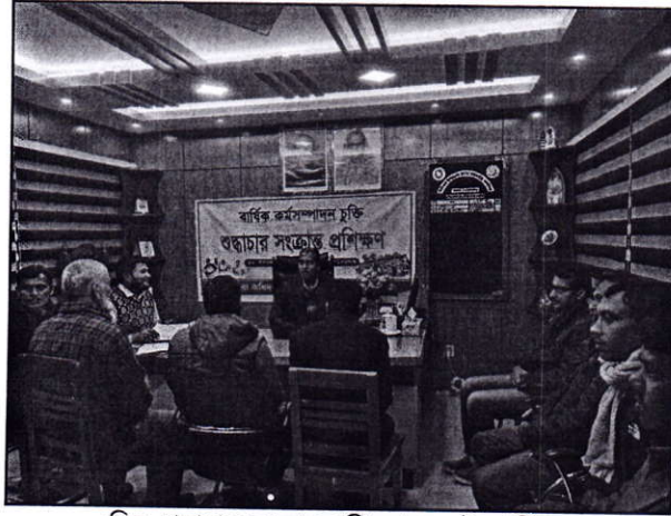
চিত্র: শুদ্ধাচার সংক্রান্ত প্রশিক্ষণ (২য় ত্রৈমাসিক)