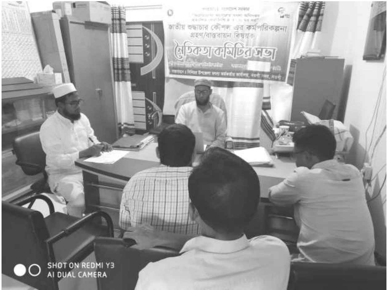
চিত্রঃ নৈতিকতা কমিটির ৪র্থ সভা ।