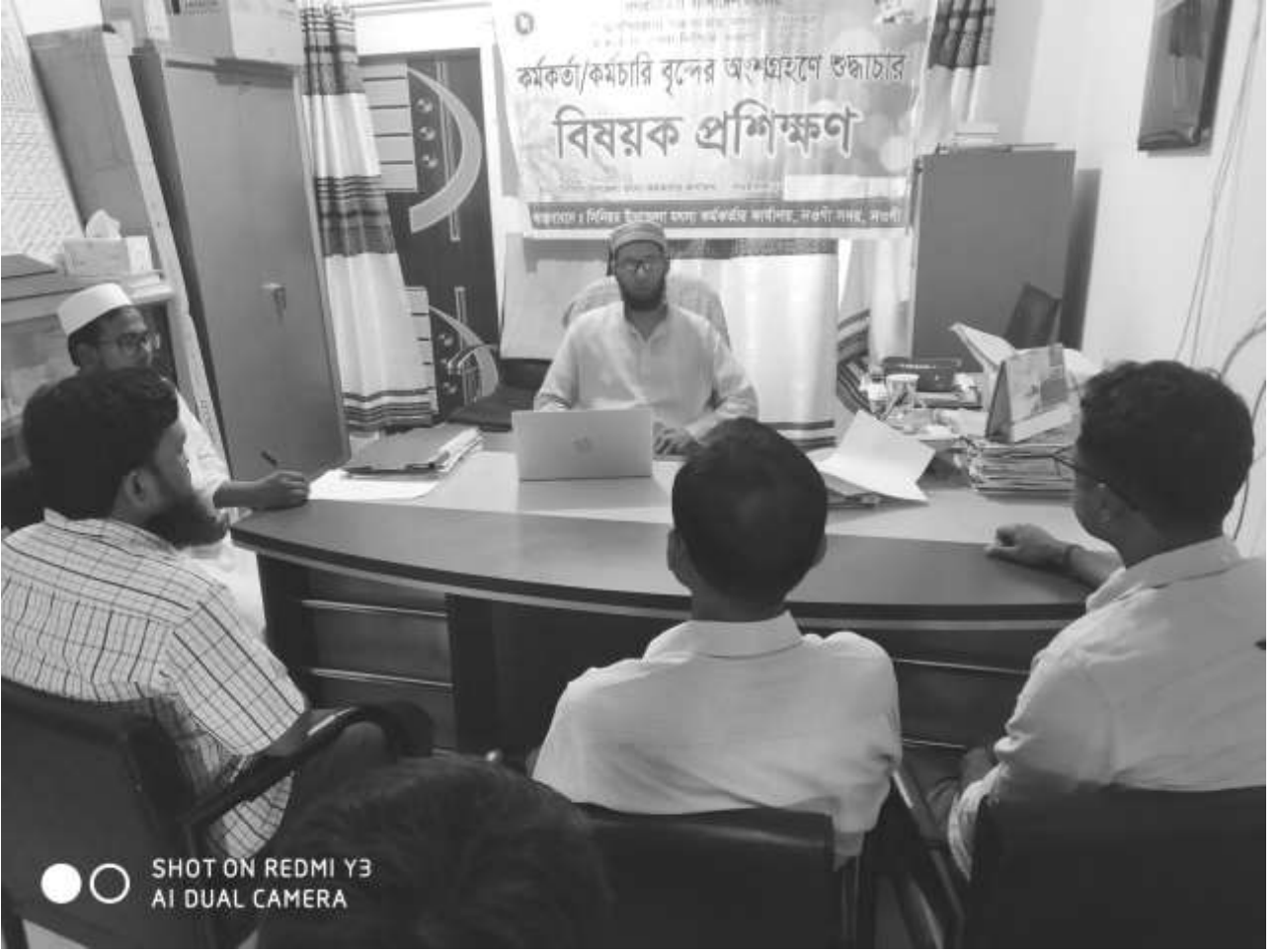
চিত্র: বার্ষিক কর্মসম্পাদন চুক্তির আওতায় শুদ্ধাচার কৌশল কর্মপরিকল্পনা বাস্তবায়নে শুদ্ধাচার বিষয়ক ২য় ষাণ্মাসিক প্রশিক্ষণ ।