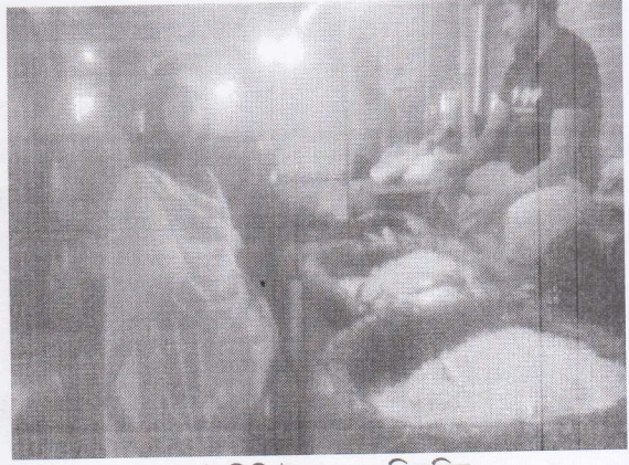
পাঁচবিবি উপজেলার স্থিরচিত্র