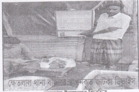
ক্ষেতলাল থানা বাজারে স্থাপনকৃত জটকা ডিভাইস ক্ষেতলাল উপজেলার স্থিরচিত্র