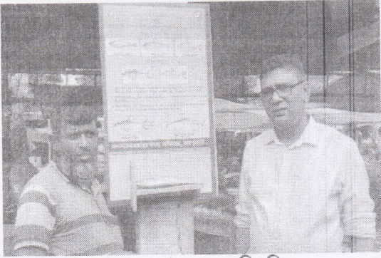
আক্কেলপুর উপজেলার স্থিরচিত্র