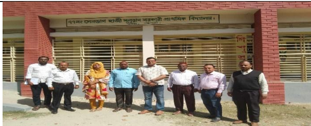
উপজেলা নির্বাহী অফিসার কর্তৃক পিইডিপি-৪ এর আওতায় নির্মাণ কাজ সম্পন্ন হয়েছে এমন বিদ্যালয় পরিদর্শন