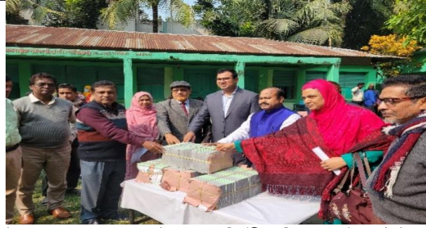
উপজেলা চেয়ারম্যান ও উপজেলা নির্বাহী অফিসার কর্তৃক পাঠবই বিতরণ