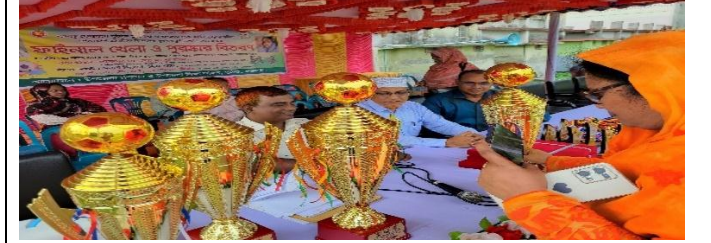
বঙ্গবন্ধু ও বঙ্গমাতা বেগম ফজিলাতুন নেছা মুজিব গোল্ডকাপ ফুটবল টুর্নামেন্ট