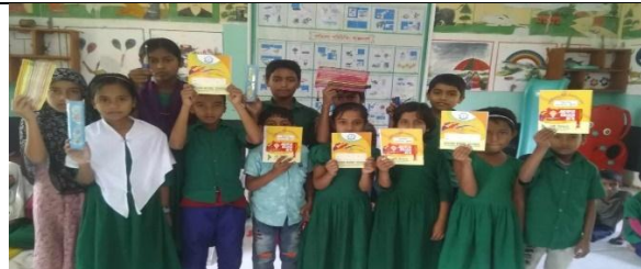
প্রাক প্রাথমিক শিক্ষার্থীদের হাতেখড়ি অনুষ্ঠান