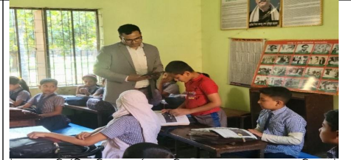
উপজেলা নির্বাহী অফিসার কর্তৃক সাবলিল ভাবে পড়তে পারা অগ্রগতি যাচাই