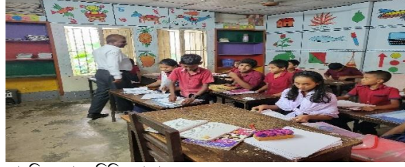
সাবলিল ভাবে রিডিং পড়া