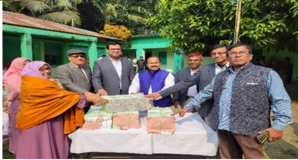
বই বিতরণ ২০২৪