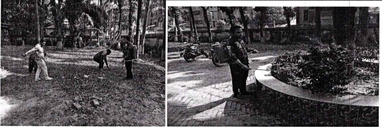
২. অফিস ভবন ও চারিপাশ পোকামাকড়, মশক ও জীবাণুমুক্তকরণ