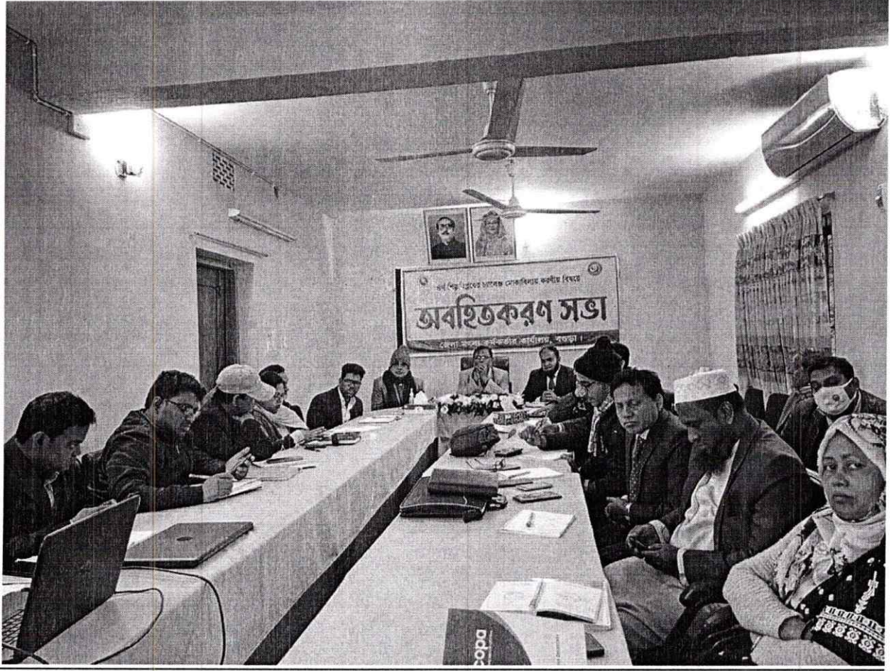
চতুর্থ শিল্পবিপ্লবের চ্যালেঞ্জ মোকাবেলায় করণীয় বিষয়ে অবহিতকরণ সভার স্থিরচিত্র