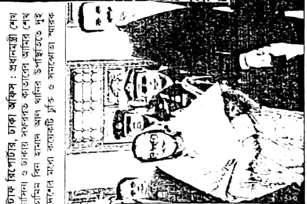
স্টাফ রিপোর্টার, ঢাকা অফিস : প্রধানমন্ত্রী শেখ হাসিনা ও চাকরায় সংবলিত কাতারের আমির শেখ তাহমিন বিন হামাদ আল থানির উপস্থিতিতে দুই দেশের মতাবে সফটওয়্যার চুক্তি ও সমঝোতা স্মারক

ডেপুটি : বাংলাদেশের : পরিস্থিতি নিয়ে কড়া করেতে মুক্তবুদ্ধি। দেশটি বাংলাদেশে যারিনি বাধা দেয়া হয়। আছে দুই নির্বাচনের মাধ্যমে যে তাদের সরকার নাগরিকদের অক্ষমতা। সরকারের আড় মারাত্মক দেশের ভেতরে এবং : মানবাধিকার বিষয়ক গার ওপর সরকারের পন্থার অথবা হযরানি সামরিক বার্ষিক ওই প্রকাশ্য করা হয়। (২ পৃঃ ৪ কঃ ৫ঃ)