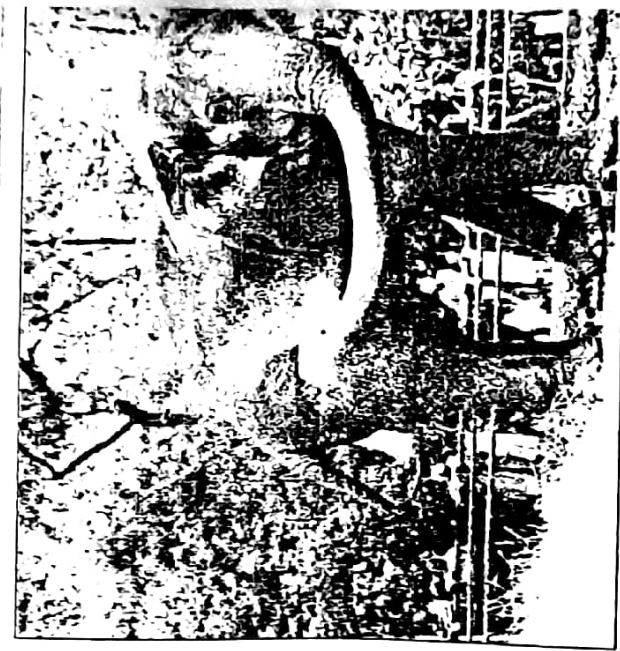
দেশের চলমান দাবিদাহে ইপিজেডে উঠেছে প্রাণিকুলও। তাই গরম থেকে বাচতে এক হাতি। ছবিটি গতকাল রাজধানীর জাতীয় চিড়িয়াখানা থেকে তোলা