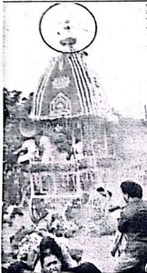
১৪ সালে বৈদ্যুতিক তারের স্পর্শে (সাল গোল চিহ্নিত) বহু মানুষ হতাহত হন