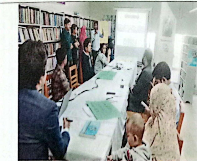
গ্রুপ প্রেজেন্টেশন ২