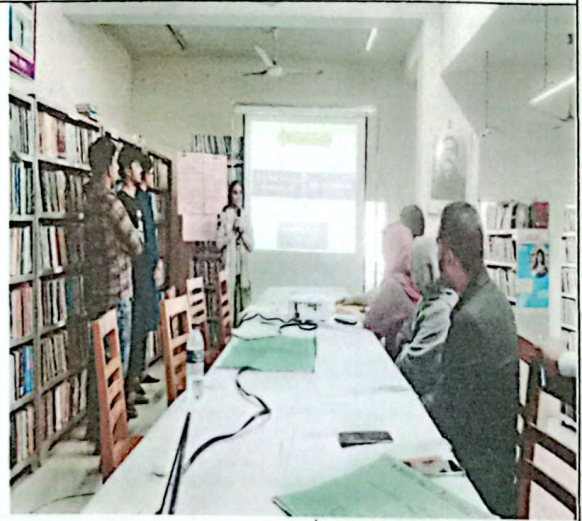
গ্রুপ প্রেজেন্টেশন ১