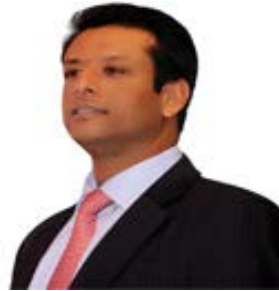
জনাব সজীব ওয়াজেদ

মাননীয় প্রধানমন্ত্রীর তথ্য ও যোগাযোগ প্রযুক্তি বিষয়ক মাননীয় উপদেষ্টা