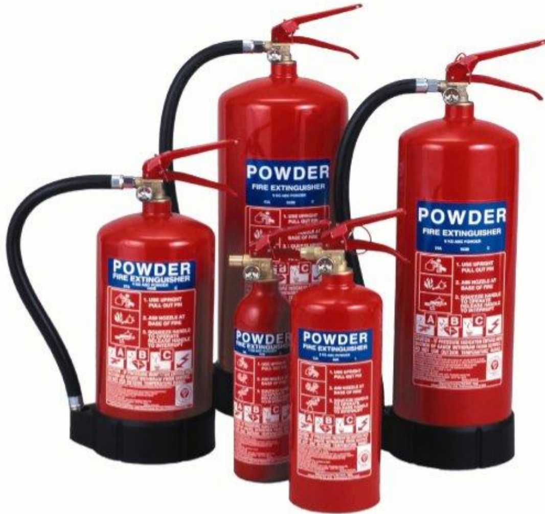
চিত্রঃ অগ্নিনির্বাপক যন্ত্র