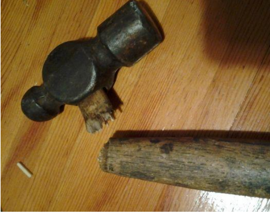
চিত্রঃ হাতল ভাঙ্গা হাতুড়ি