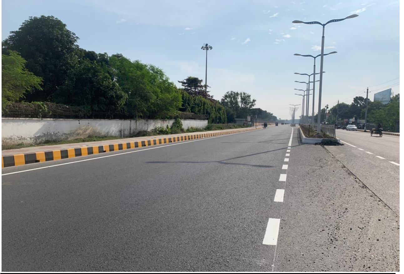
রোড মার্কিংকৃত মহাসড়ক (সূচন : ২.১.২)