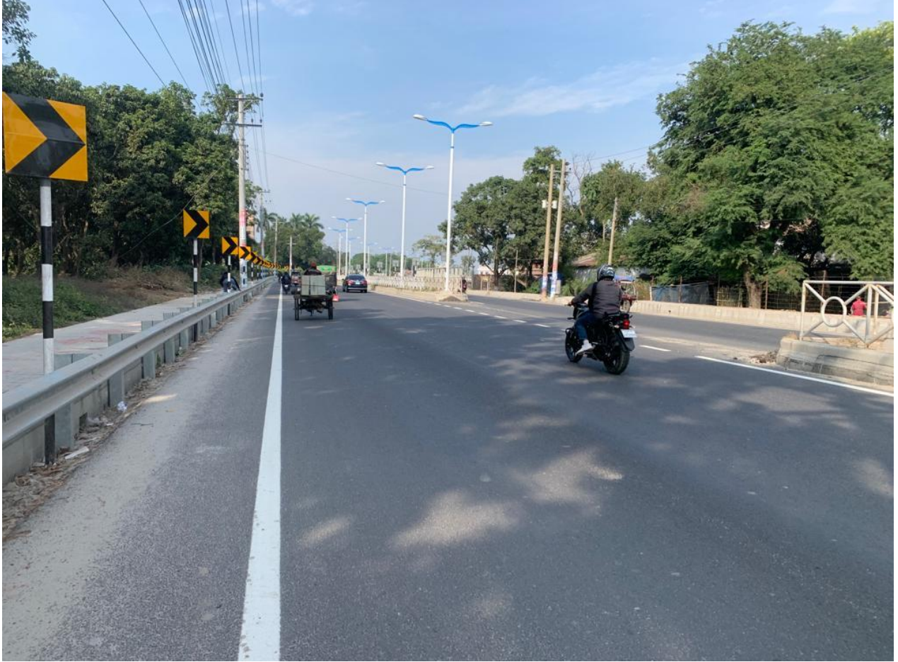
সার্বসেংিক্ত মহাসড়ক (সুচক : ১.৫.১)