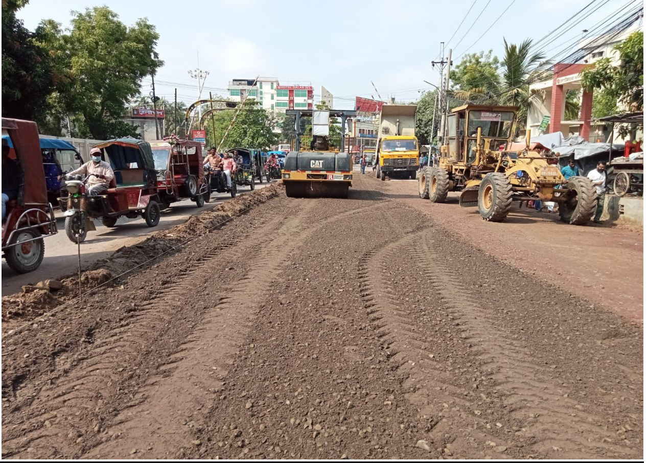
মজবুতকিরণকৃত সড়ক (সূচক : ১.৩.১)