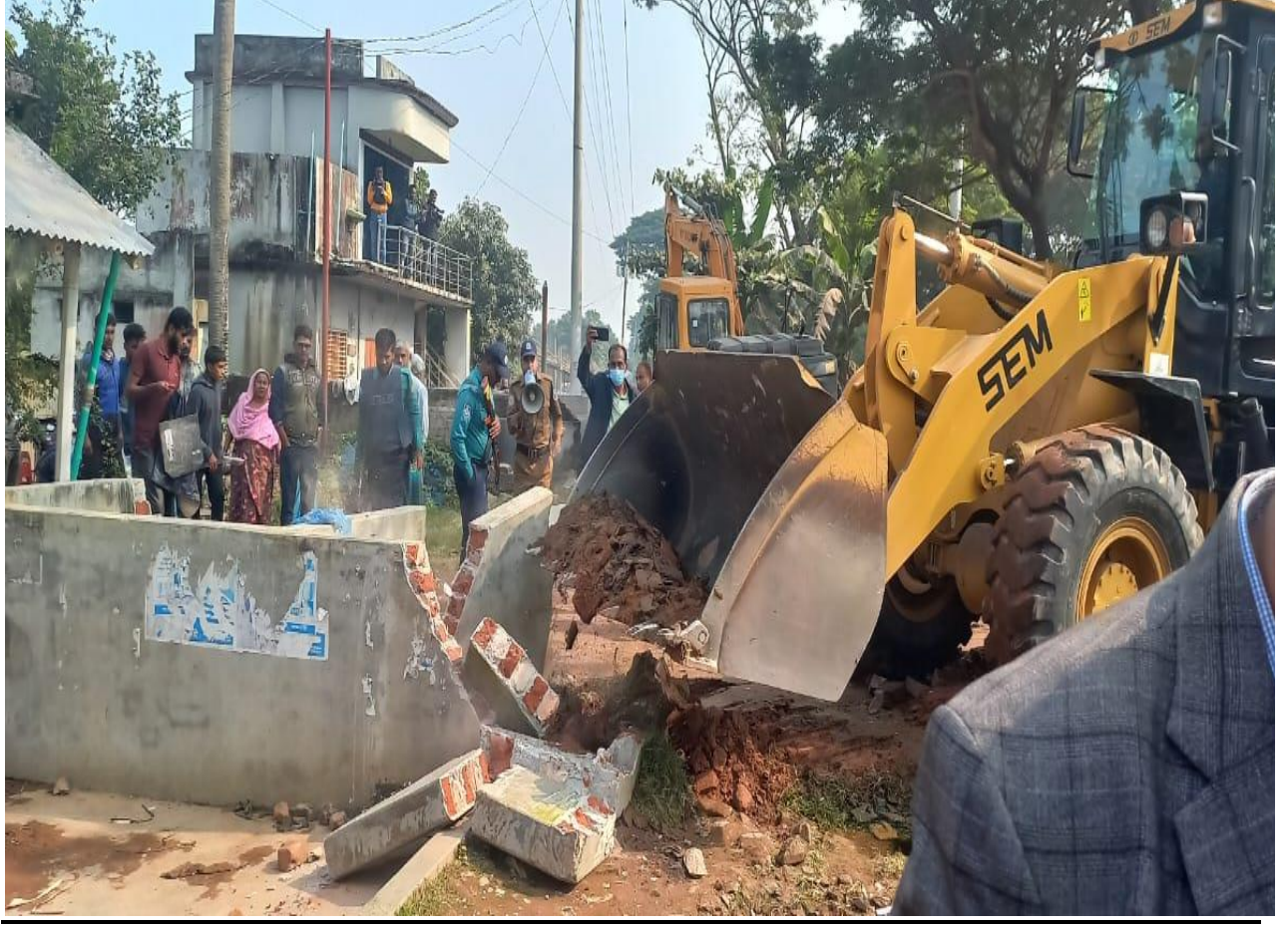
অভিযান পরচালনার মাধ্যমে উদ্ধারকৃত ভূমি (সূচক-২.২.১)