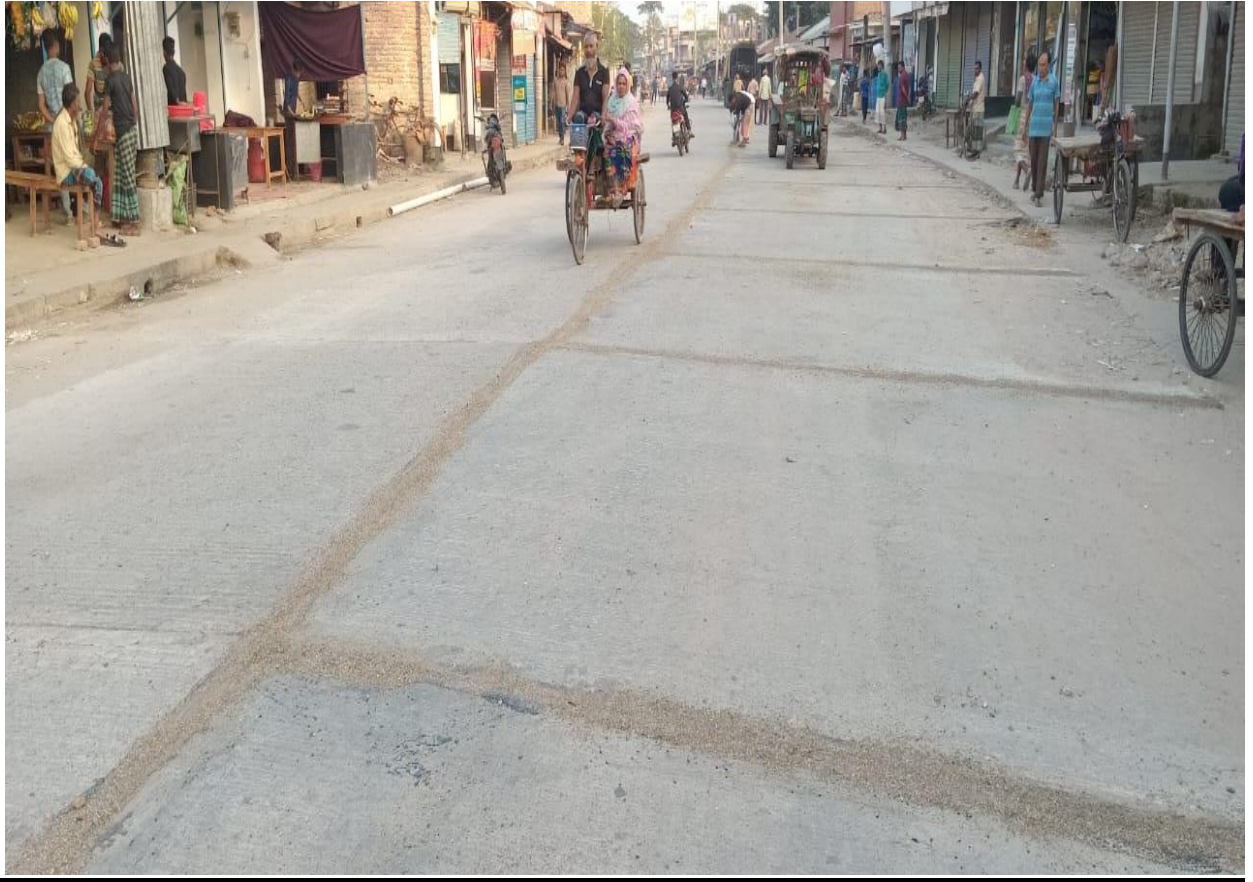
রাজিডি পভেমেন্টকৃত মহাসড়ক (সুচক-১.৭.১)