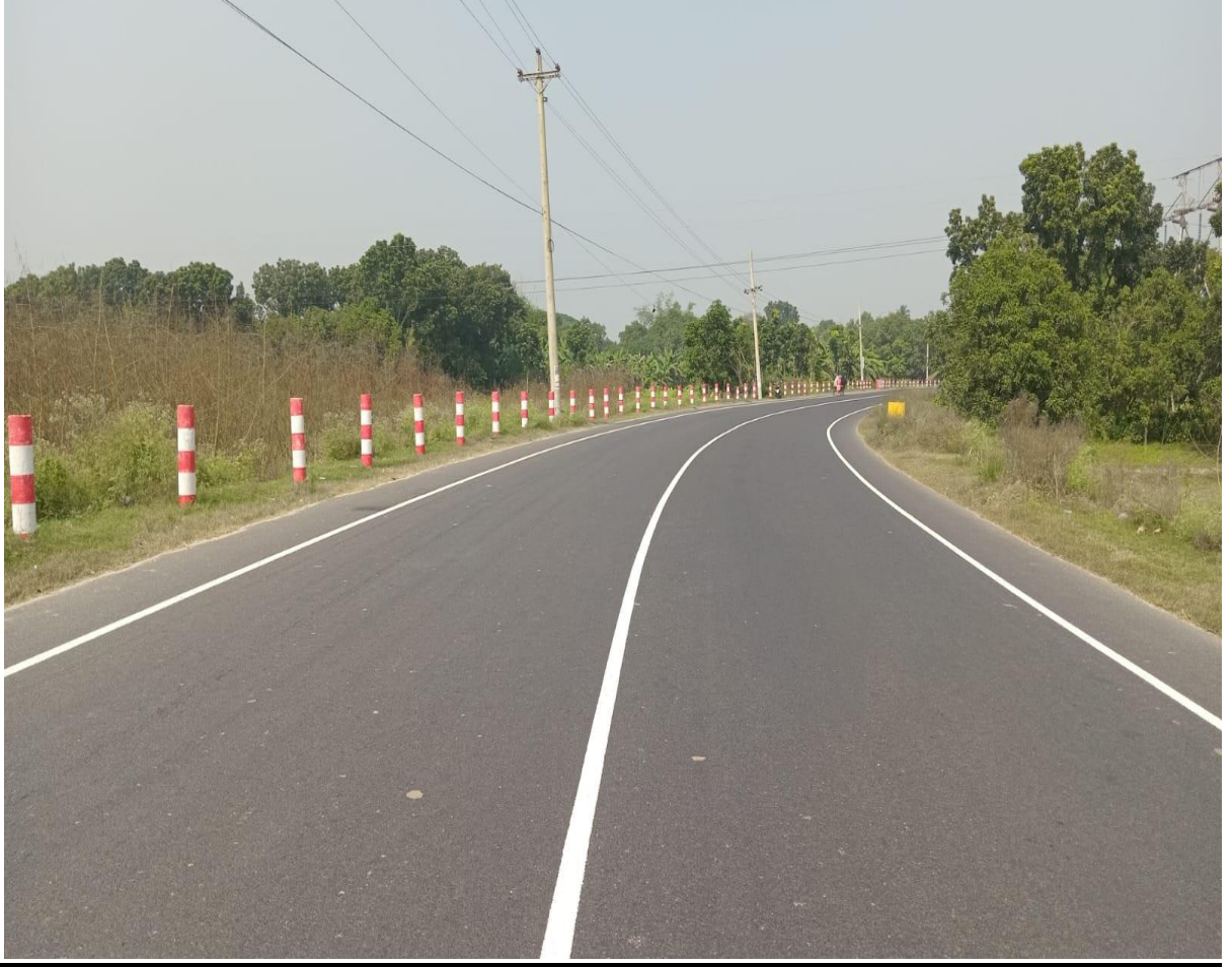
পুনঃনির্মিত মহাসড়ক (সূচক : ১.২.১)