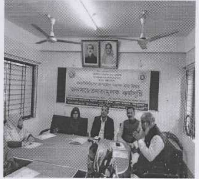
জনপ্রতিনিধিদের অংশগ্রহণে নিরাপদ খাদ্য বিষয়ে জনসচেতনতামূলক কর্মসূচি