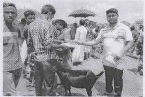
দুর্গামহ হাট, জয়পুরহাট