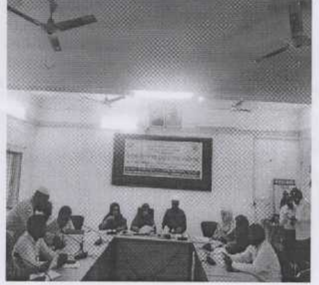
উপজেলা নিরাপদ খাদ্য ব্যবস্থাপনা সমন্বয় কমিটির সভা