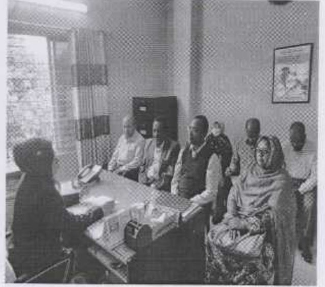
নিরাপদ খাদ্য পরিদর্শকদের সাথে মাসিক সভা