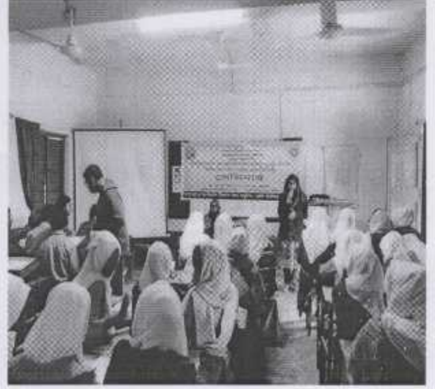
নিরাপদ খাদ্য বিষয়ক জনসচেতনতামূলক স্কুল সেমিনার