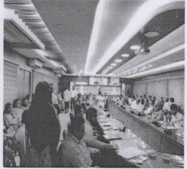
জেলা নিরাপদ খাদ্য ব্যবস্থাপনা সমন্বয় কমিটির সভা