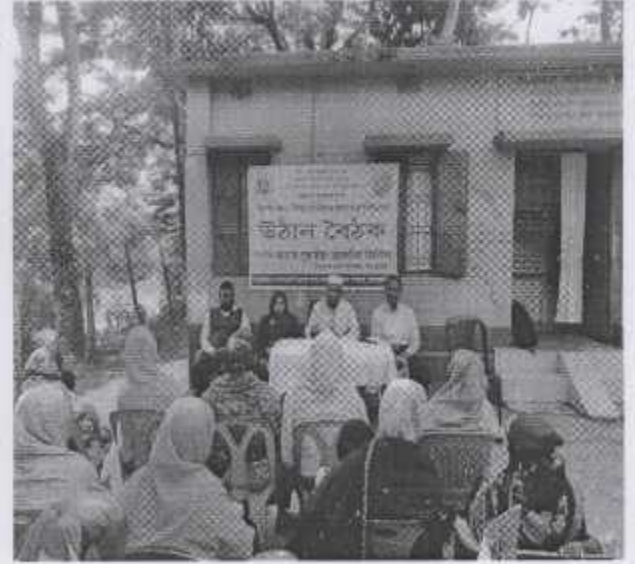
নিরাপদ খাদ্য বিষয়ক উঠান বৈঠক