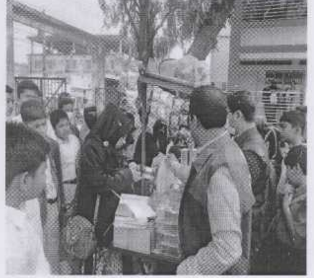
স্ট্রিট ফুড মনিটরিং