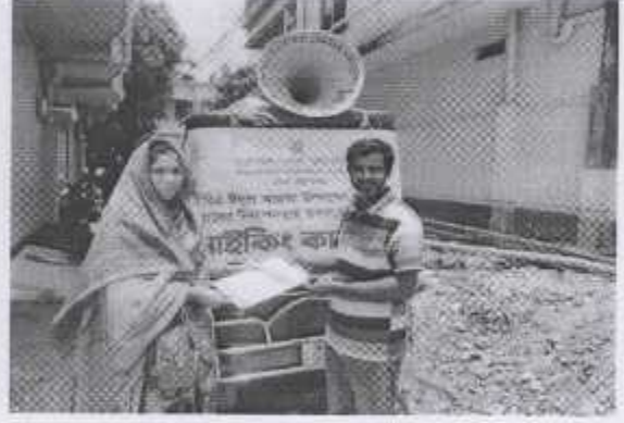
ঈদুল আজহা উপলক্ষে জনসচেতনতামূলক মাইকিং কার্যক্রম ও লিফলেট বিতরণ