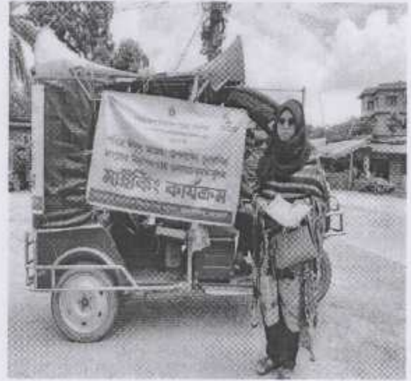
ক্ষেতলাল ও কালাই উপজেলা, জয়পুরহাট